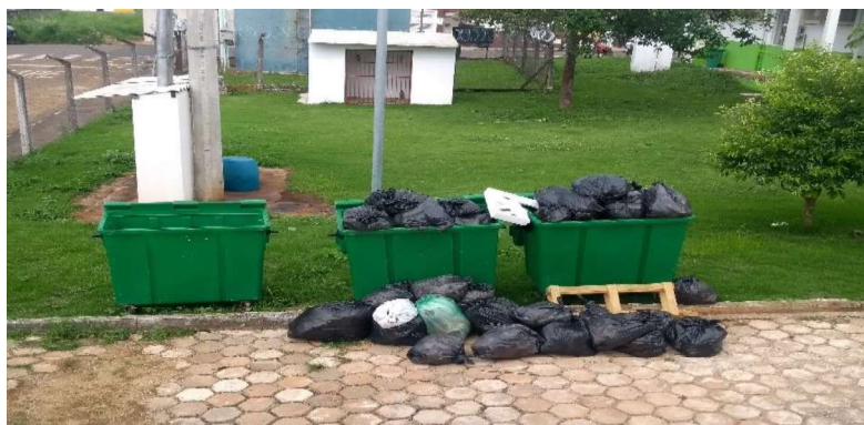
Figura 3: Imagem que embasa a observação da realidade e identificação do problema a ser abordado na proposta da SD.

No primeiro encontro deve haver apresentação de todos os participantes. Em seguida os estudantes são expostos ao problema a partir da observação da realidade, conforme salientam Colombo e Berbel (2007, p. 125) ao afirmarem que “o estudo/a pesquisa se dá a partir de um determinado aspecto da realidade (Quadro 1). Então, a primeira etapa é a da Observação da realidade e definição do problema”. A Figura 3 ilustra o problema que afeta a realidade local, ou seja, o acúmulo de lixo e resíduos dentro do campus de uma Instituição de Ensino Superior, mas que pode ser extrapolada para outros contextos similares.