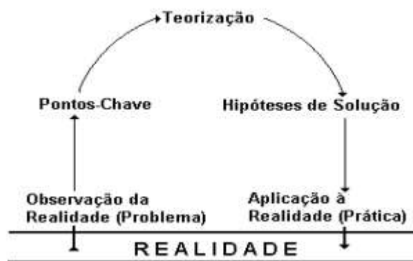
Figura 1: Arco de Maguerez.

Fonte: Extraído de Colombo e Berbel (2007, p. 125).